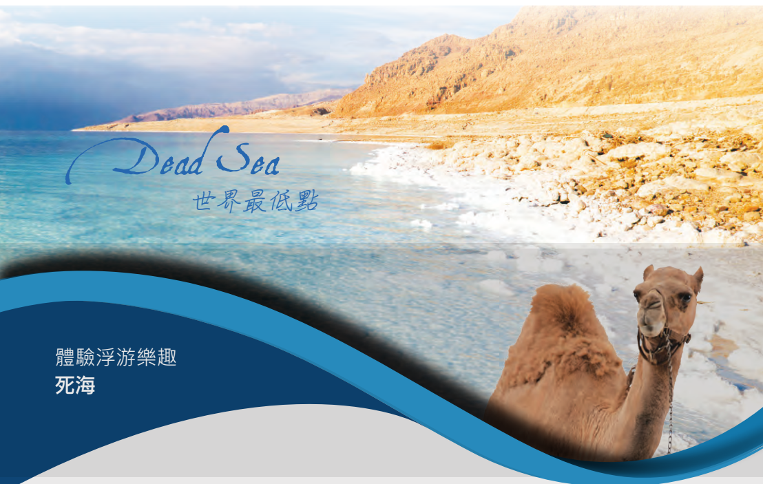
體驗浮游樂趣 死海

Dead Sea 死海 位於以色列、約旦邊境，死海是全世界海拔最低的地方，更因含鹽量極高、浮力極強，成為當地最熱門的旅遊景點。其中富有豐富的礦物成為現代的美容聖地，塗著黑泥浮在死海之中，是一種特別的漂浮體驗。不會游泳的人也能輕鬆的在水上浮起，您更可嘗試躺在 低於海平面414公尺的死海上看報紙 ，為人生一大奇特經驗。而鄰近居高臨下的 馬薩達古城 ，不僅擁有超過2000年的建築遺跡，還有可歌可泣的戰爭歷史，同樣值得一探。